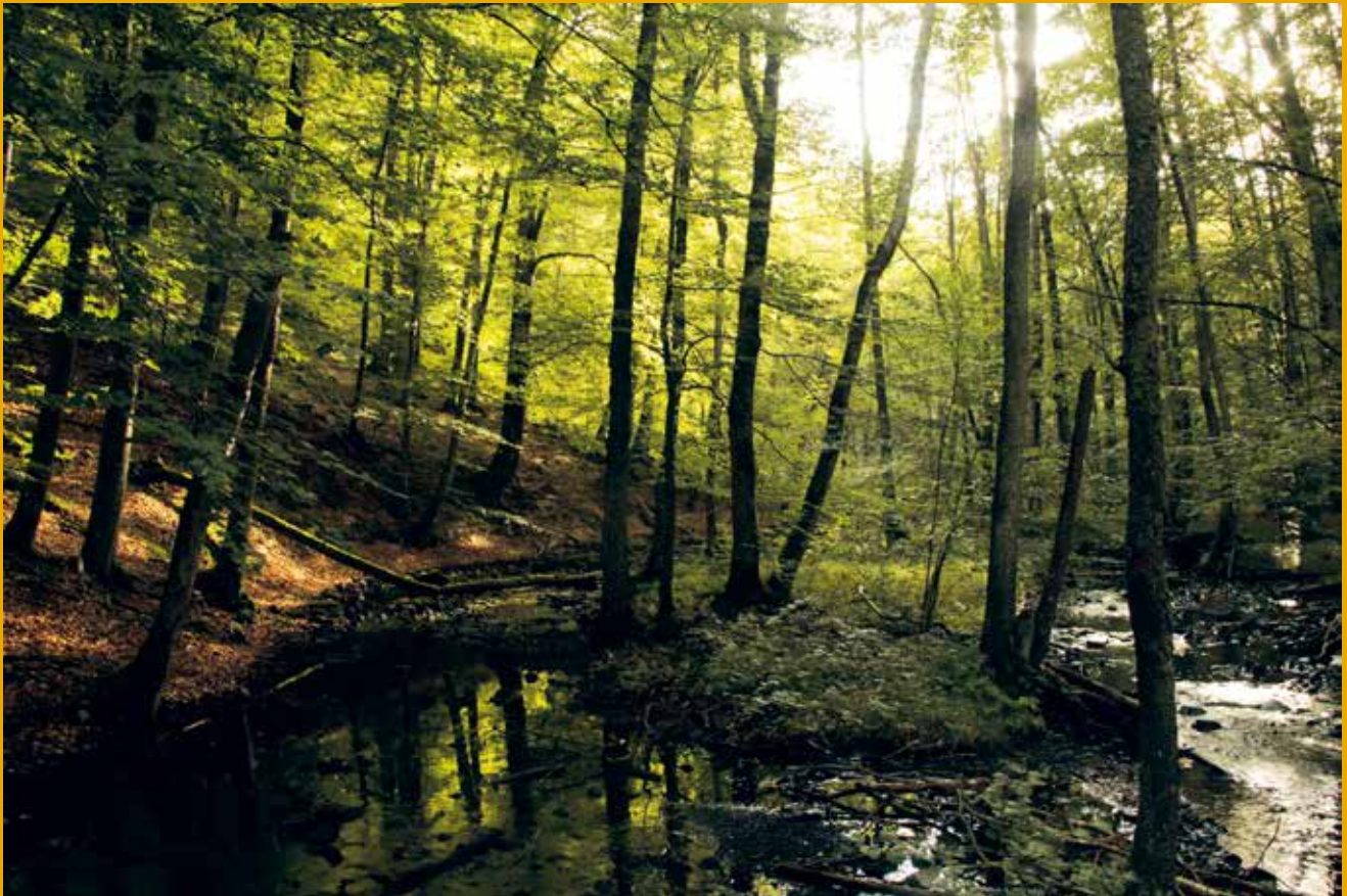
Figur 1. Bilden illustrerar ett bäckavsnitt med höga naturvärden, liten påverkan av människa och med en hög känslighet för skogsbruk i kantzonen. Mälklass VO – vattenmiljö bör lämnas orörd.