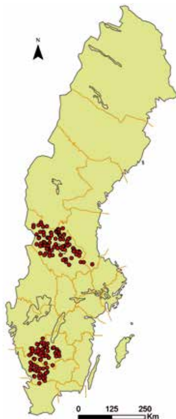
Figur 3. Lokalisering av källvattendrag som ingick i studien.

NPK+ och Blā mōlklassning har utvārdats med hjālپ av data från elfisken i tvā tidigare studier. Resultaten visade att vattendrag i Blekinge som indelats i Blā mōlklasser med hōgre hōnsynsnivā vid skogsbruk innehōll fler antal fiskarter (Ingemarsson 2012). Liknande samband hittades vid en inventering av 55 vattendrag i Vāsterbotten. Dār fanns ett positivt samband mellan antalet fiskarter och vattendrag som hade en hōgre NPK+-totalsumma (Nordin 2012). Detta pekar pā att vattendrag med bra fōrutsāttningar att hysa en rik biologisk mōngfald kan identifieras med verk-