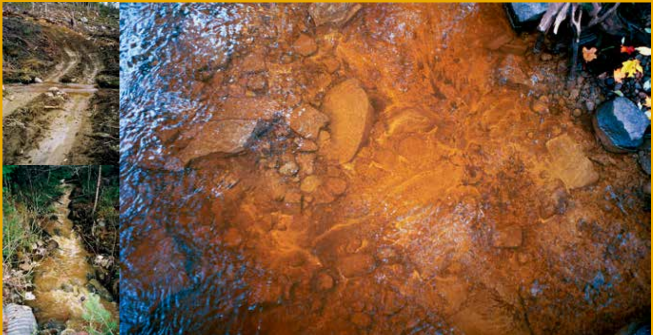
Figur 2. Kōrskada i samband med slutavverkning kan orsaka erosion, grumling och igenslamning av botten om inte rōtt hōnsyn tas.

■ Vatten är livsnōdvāndigt. Fōr att āven kommande generationer ska kunna utnyttja denna gemensamma resurs ār det av stor vikt att den brukas pā ett hōllbart sōtt. EU:s ramdirektiv fōr vatten (vattendirektivet, 2000/60/EG) trōdde i kraft ār 2000. Vattendirektivet innebēar en helhetssyn pā vatten dār medlems-