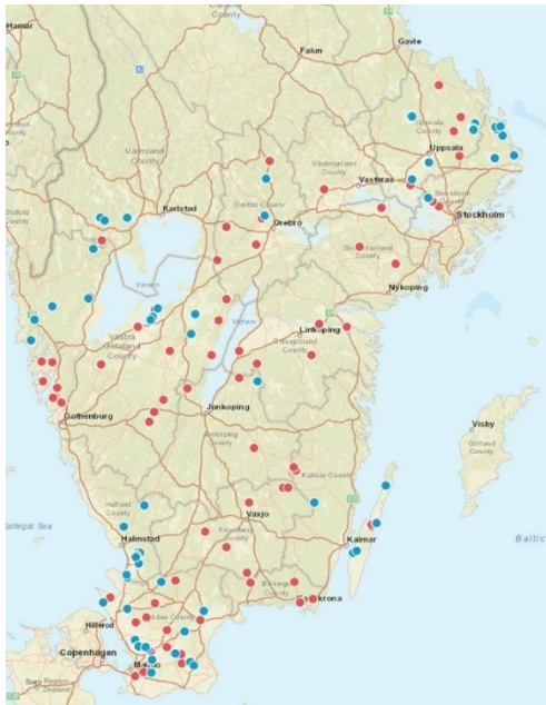
Figur 1. Geografisk fördelning för de platser där selektion av vitala askar gjordes under sommaren 2019. Röda prickar avser bestånd som vi fått tips om via markägare. Blå prickar avser bestånd som upptäckts i samband med 2019 års inventering.